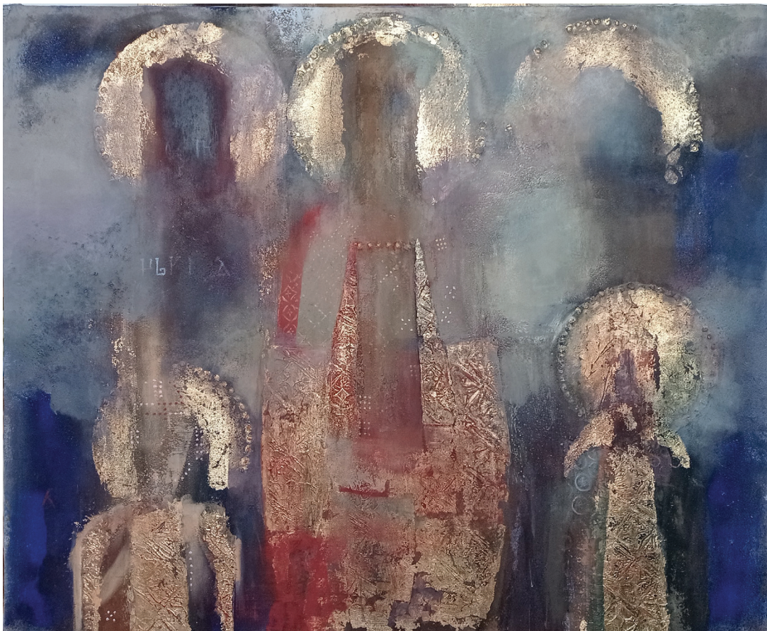
Света лоза, комбинована техника, 115 x 95 cm, из Колекције Ђуре Вукше

*фотографије дела са насловне стране: Раздвајање воде над сводом , 100 x 160 cm