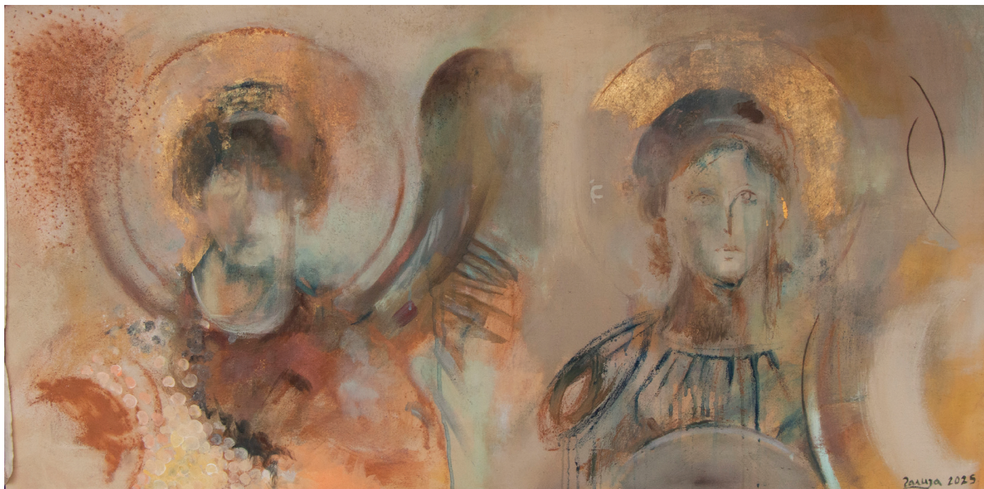
Бдење, комбинована техника, 60 x 120 cm

*фотографија дела са последње стране: Сви непознати Свети на Слави , комбинована техника, 130 x 110 cm