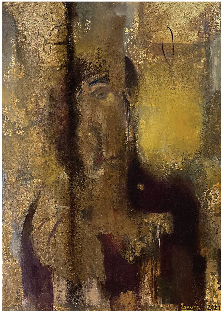
Исијавање, комбинована техника, 50 x 70 cm, у власништву из Колекције Панета Синобада