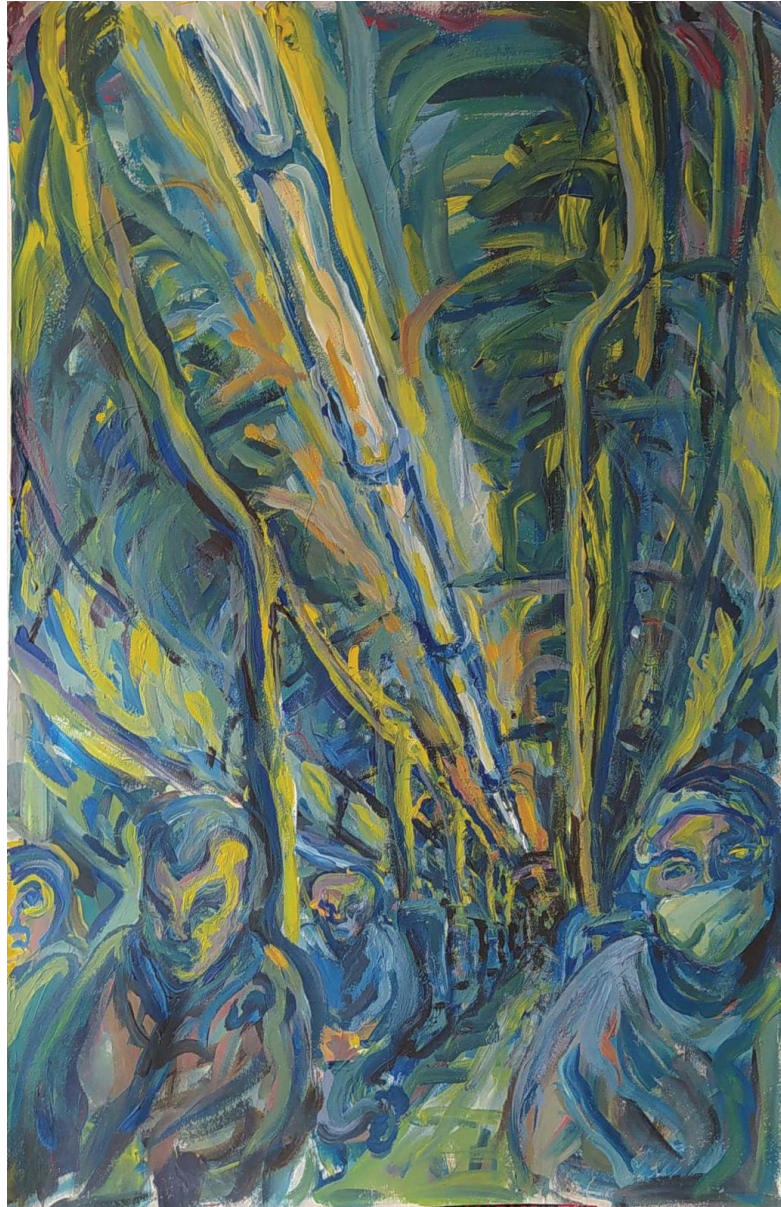
Bus 95, akril na papiru, 70 x 45 cm, 2022.