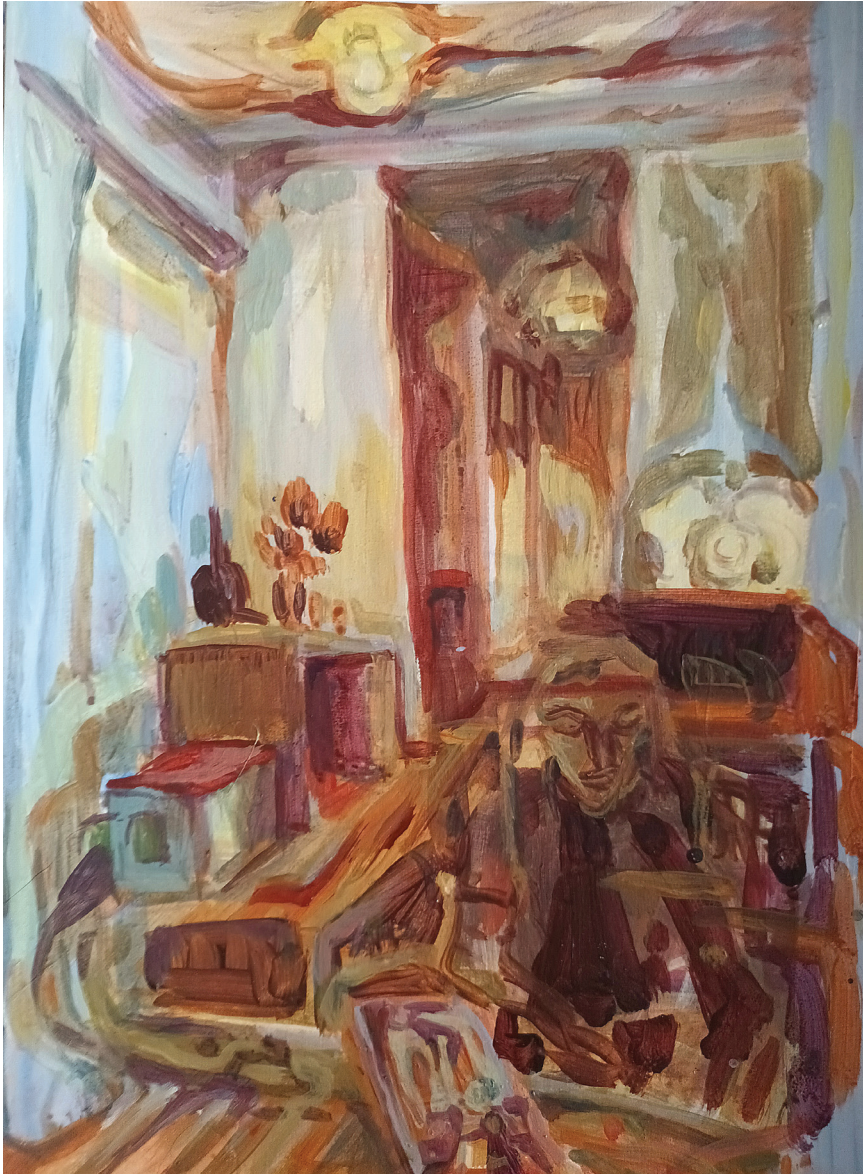
Soba 1018, akril na papiru, 42 x 29 cm, 2023.