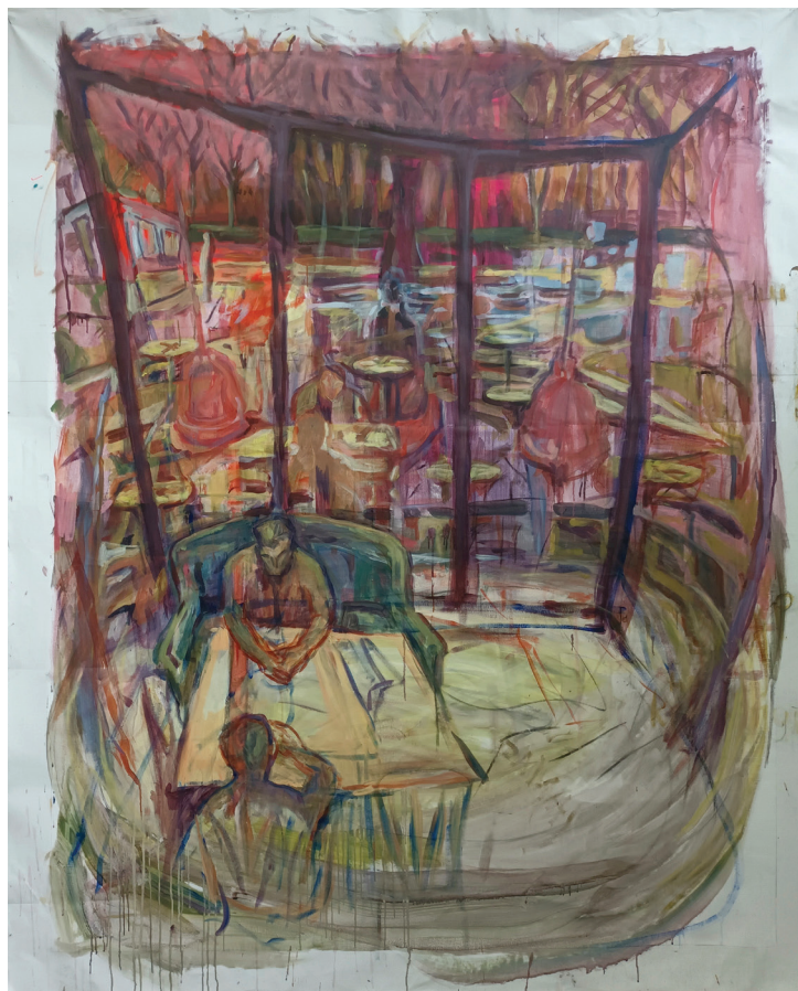
The world was melting around us, akril na platnu, 210 x 170 cm, 2024.

Izlagala je na više od 30 kolektivnih i samostalnih izložbi u Srbiji i inostranstvu, uključujući izložbe u Kini i Italiji, kao i u prostoru Nemačke ambasade u Beogradu. U svom radu istražuje pojam prostora, sa fokusom na međuprostore svakodnevnog života. Kroz smenu figuracije i apstrakcije, ispituje nevidljive granice između realnog i unutrašnjeg sveta.