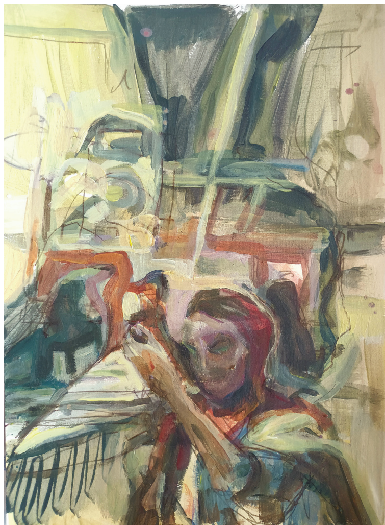
Refleksije, akril na papiru, 42 x 29,7 cm, 2023.

*fotografije dela sa naslovne strane: Kod Vanijera , akril na platnu, 160 x110 cm, 2023.